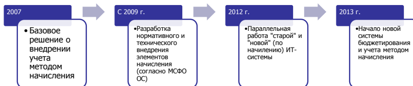
График внедрения МСФО ОС