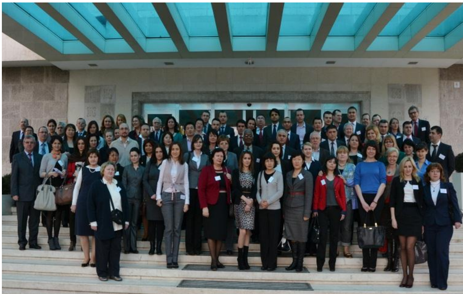
Zajednica prakse budžeta, Albanija 26. februar 2013. godine