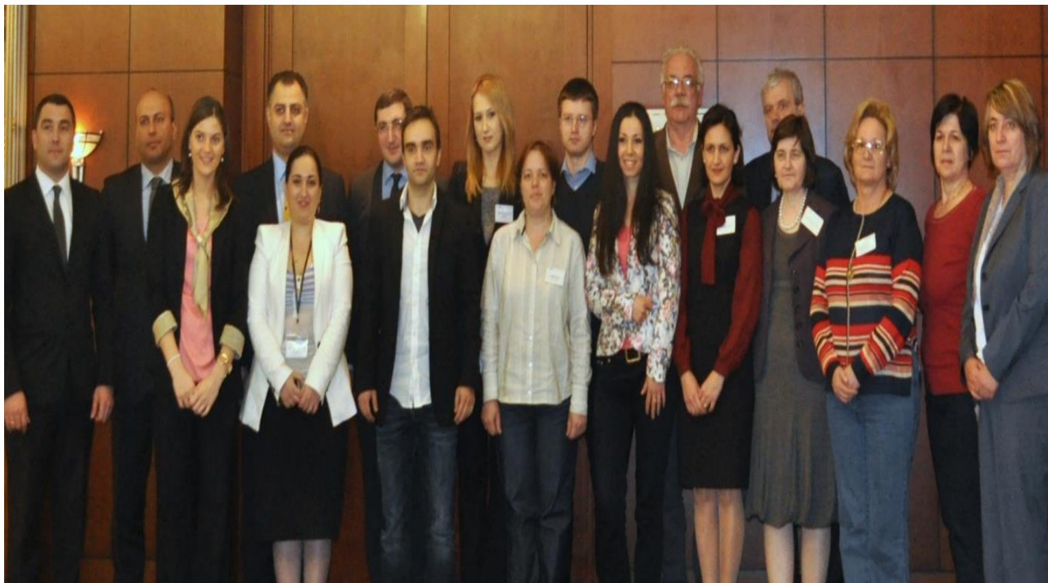
Ознакомительный визит в Минфин Грузии, апрель 2013 г.