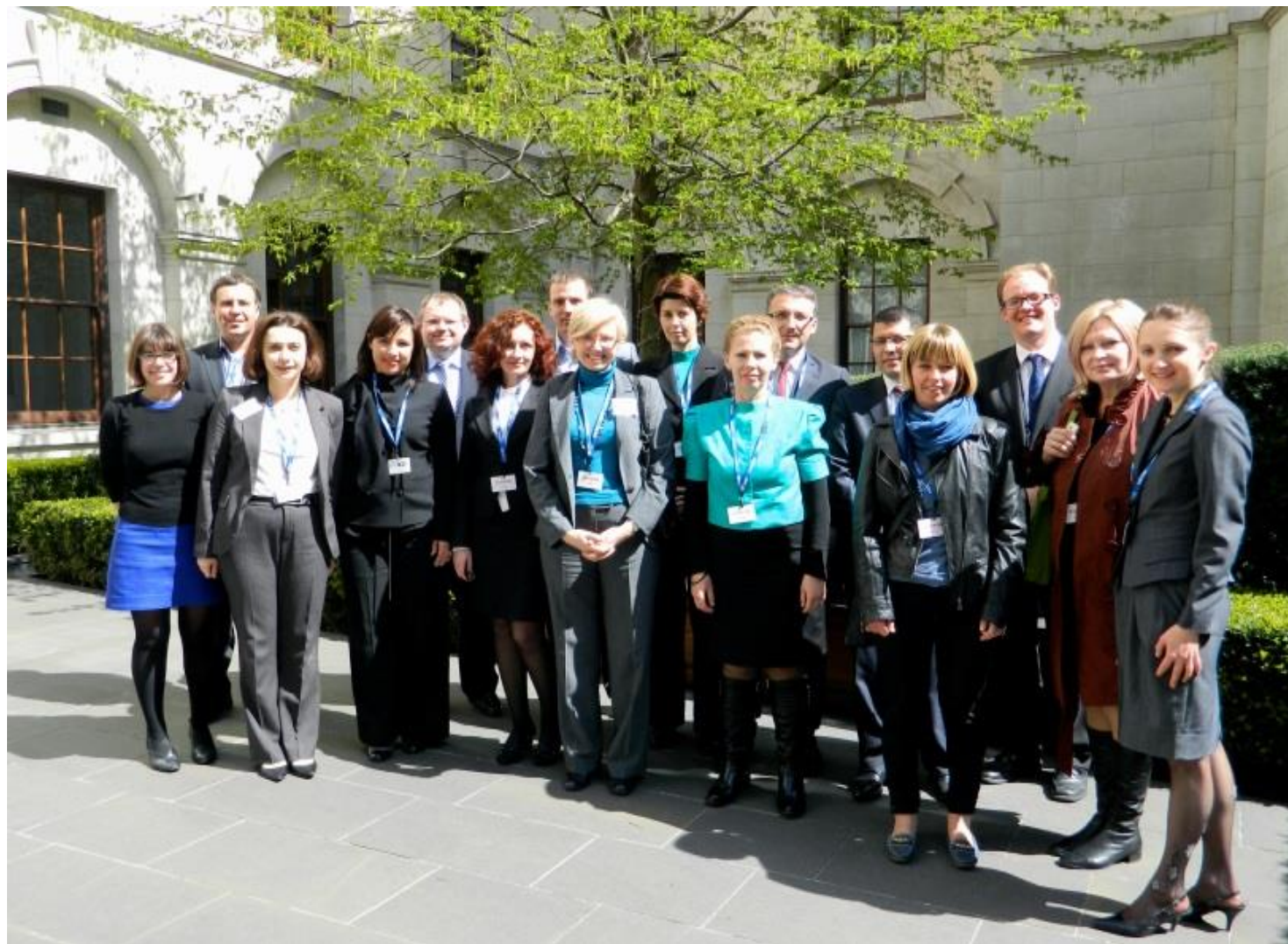
В Казначействе ее Величества, Великобритания, апрель 2013 г.