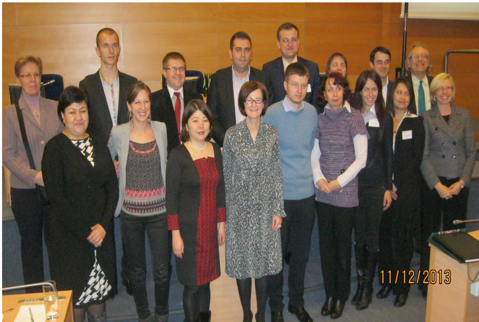
Краков, Польша, декабрь 2013 г.