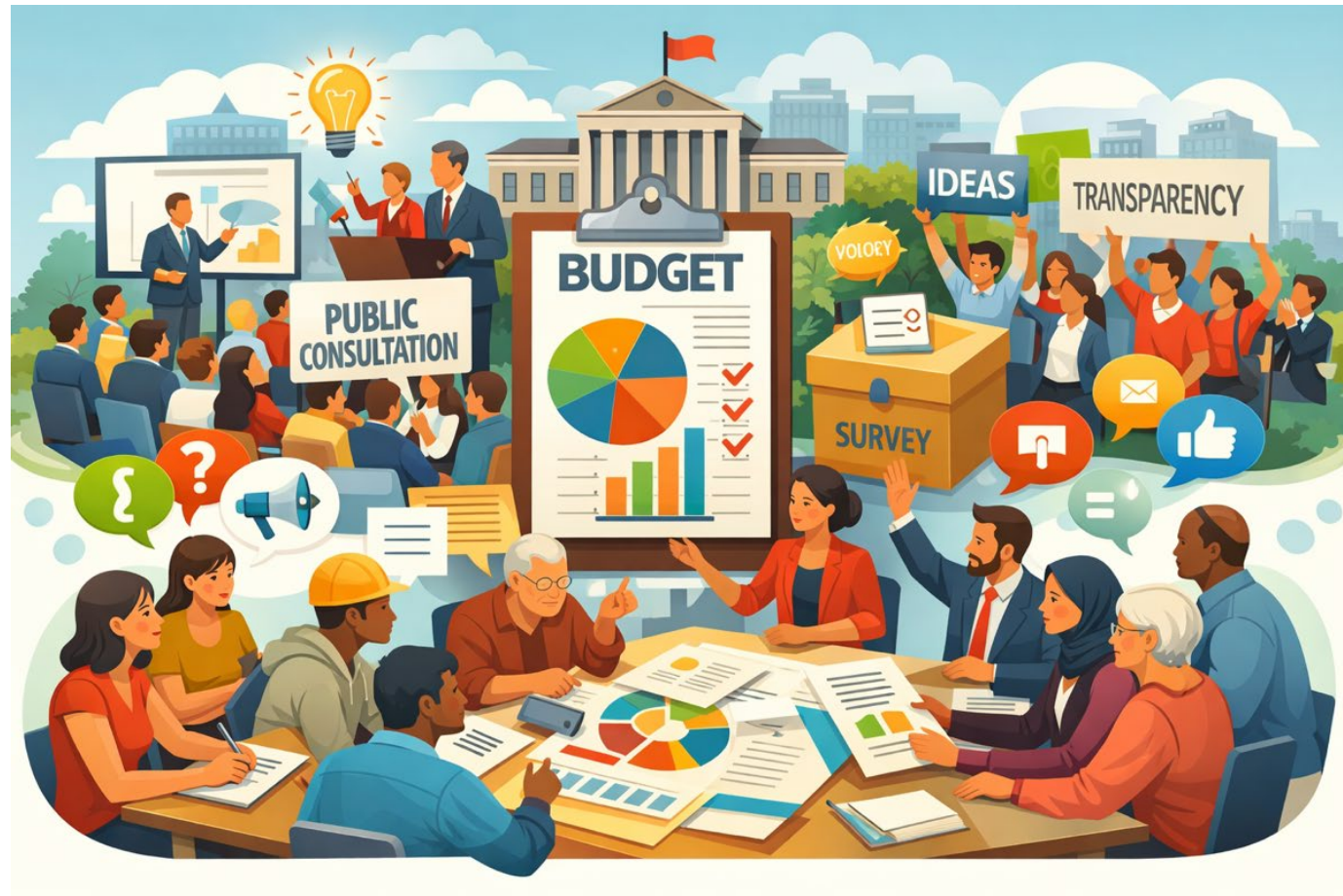
Иллюстрация, созданная с помощью ИИ