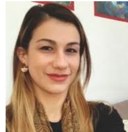
Postdoktorandica poslovne administracije (oblast revizije), Sveučilište u Pisi