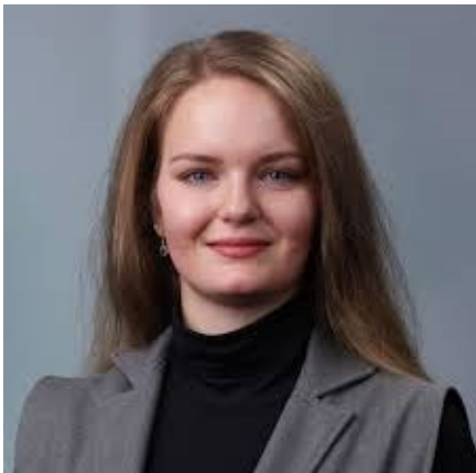
Doktorandica poslovne administracije (oblast održivosti), Sveučilište u Lundu