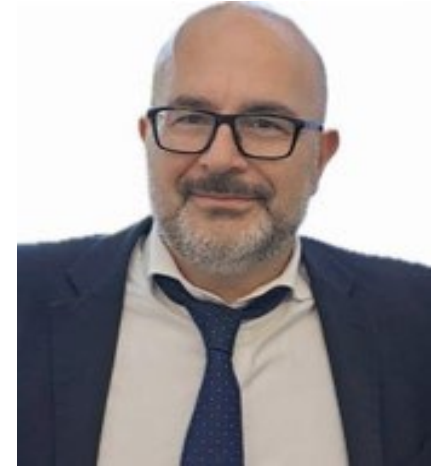
Profesor menadžmenta i računovodstva u javnom sektoru, Sveučilište u Kristianstadu i Nord Sveučilište