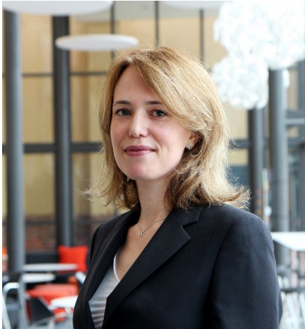
Izvanredna profesorica upravljačkih kontrola, Sveučilište u Kristianstadu